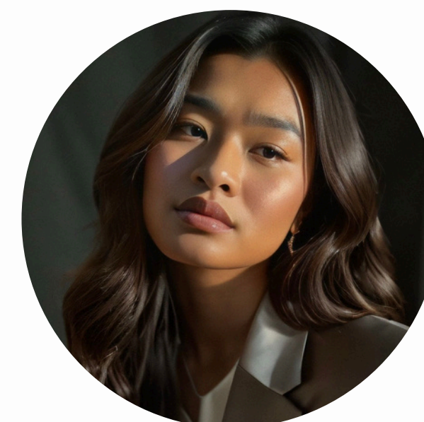
Hanh line CHASTANT